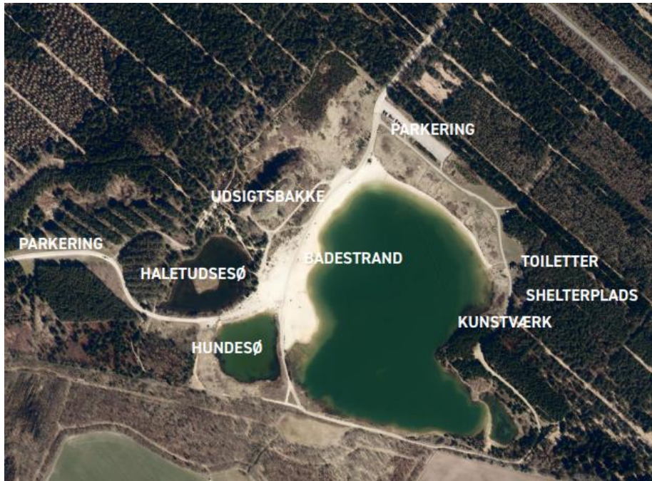
Luftfoto af Nysø-området med markering af nuværende faciliteter.