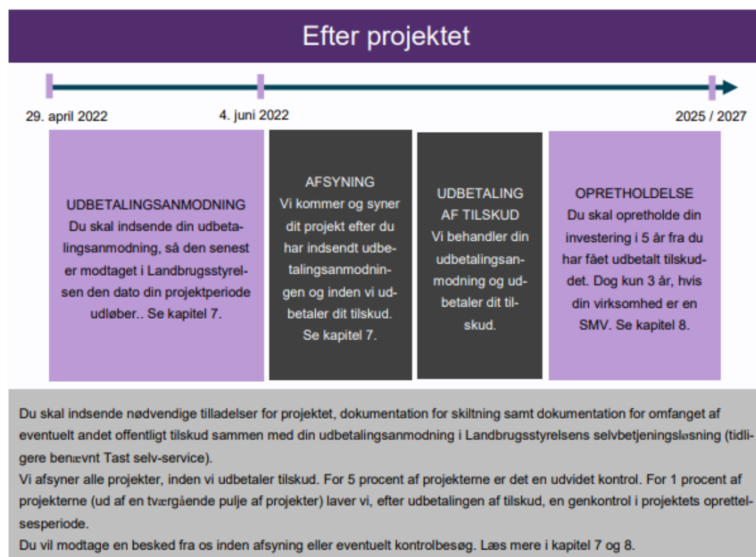
FIGUR 8.1. Tidslinje for fasen "efter projektet".

I figur 8.1. nedenfor kan du se en tidslinje for fasen efter projektet, som viser, hvad der skal ske, mens du skal opretholde projektet.