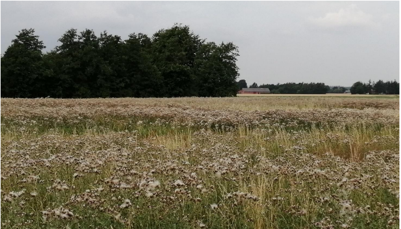
Foto: Frøspredning fra tidsel. De fnugformede frø spreders sig i store mængder med vinden over store afstande, til stor gene og ulempe for især økologisk produktion.

Det giver sig selv, at det er uhensigtsmæssigt med en betydelig frøspredning af tidsel, og at det er hensigtsmæssigt at forsøge at minimere frøspredningen. Dette sker bedst ved hyppig slåning i perioden inden frøsætning og frøspredning. Ventes der til 31.07., er skaden sket.