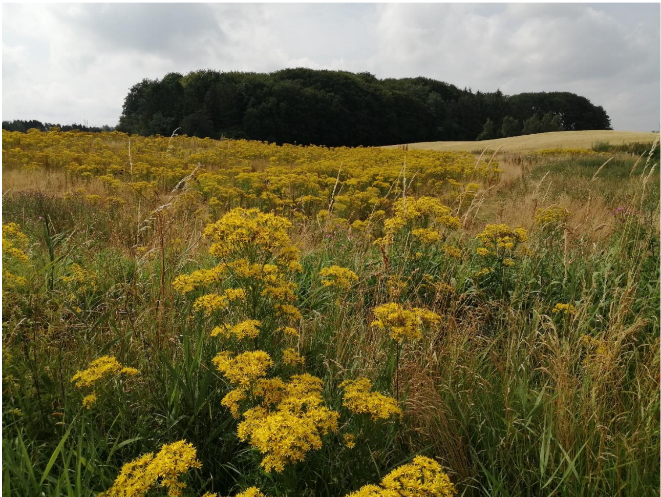
Foto: Ekstensiveret areal helt domineret af den giftige engbrandbæger.

Det giver sig selv, at det er u hensigtsmæssigt med en betydelig frøspredning af engbrandbæger, og at det er hensigtsmæssigt at forsøge at minimere frøspredningen. Dette sker bedst ved hyppig slåning i hele sommerperioden inden frøsætning og frøspredning, altså før 31.07. Ventes der til 31.07., er skaden sket.