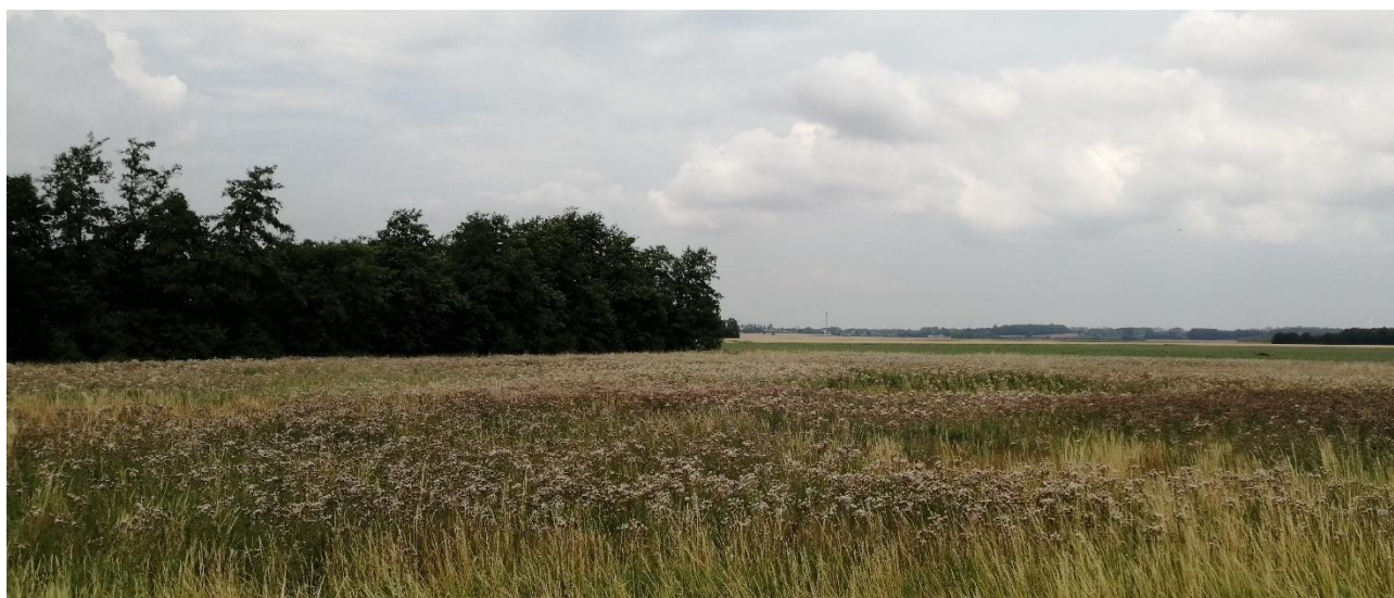
Foto: Ekstensiveret areal domineret af tidsel.

Ved slåningsforbud i perioden 01.05 – 31.07 vil der fra braklagte arealer være udbredt frøspredning fra især tidsel og engbrandbæger. Begge arter har frøsætning og frøspredning umiddelbart før slåning er tilladt. Begge har lette, fnugformede frø, der med vinden spredes vidt omkring og over store afstande og i store mængder fra brakmarker. Der sker desuden en uhensigtsmæssig spredning af frø fra skræppe, typisk til længere liggende græsmarker. Spredning af skræppefrø sker med traktorer og slåmaskiner, idet frøene netop er modne når slåning bliver tilladt (01.08.), og idet frøene lægger sig i titusindvis på traktor og slåmaskine og flyttes til græsmarker med maskinerne, hvor der typisk anvendes samme maskiner.