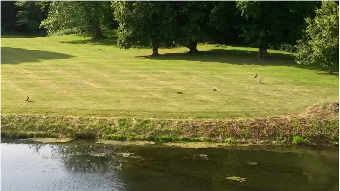
Foto: 5 harer på kortslået areal. En art, som i det generelle agerland med intensiveret afgrødedyrkning og ekstensivering af øvrige arealer har det svært.