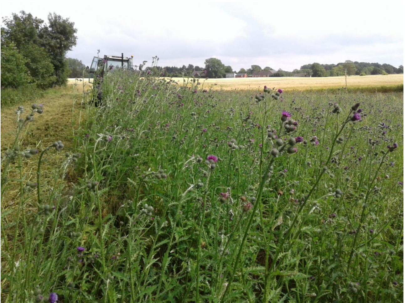
Foto: Ekstensivt areal totalt domineret af tidsel.

Erfaring (evidens) fra 90'ernes braklægning (og en større skriftlig afhandling med baggrund i feltstudier under mit agronomstudie 😊) viser, at der over en forholdsvis kort årrække på bedre jorder (Østjylland og øerne m.v.) typisk sker en succession mod få kraftige og dominerende arter, når dyrkning af et areal ophører. Det er typisk arter som græsarten kvik, desuden tidsel, brændenælde, engbrandbæger, skræppe samt gederams, der kommer til at dominere, hyppigt som monokultur. Samtlige disse arter har til fælles, at de ikke er føde for planteædende arter – hverken fugle, hare eller hjortevildt vil æde nogen af disse grove arter.