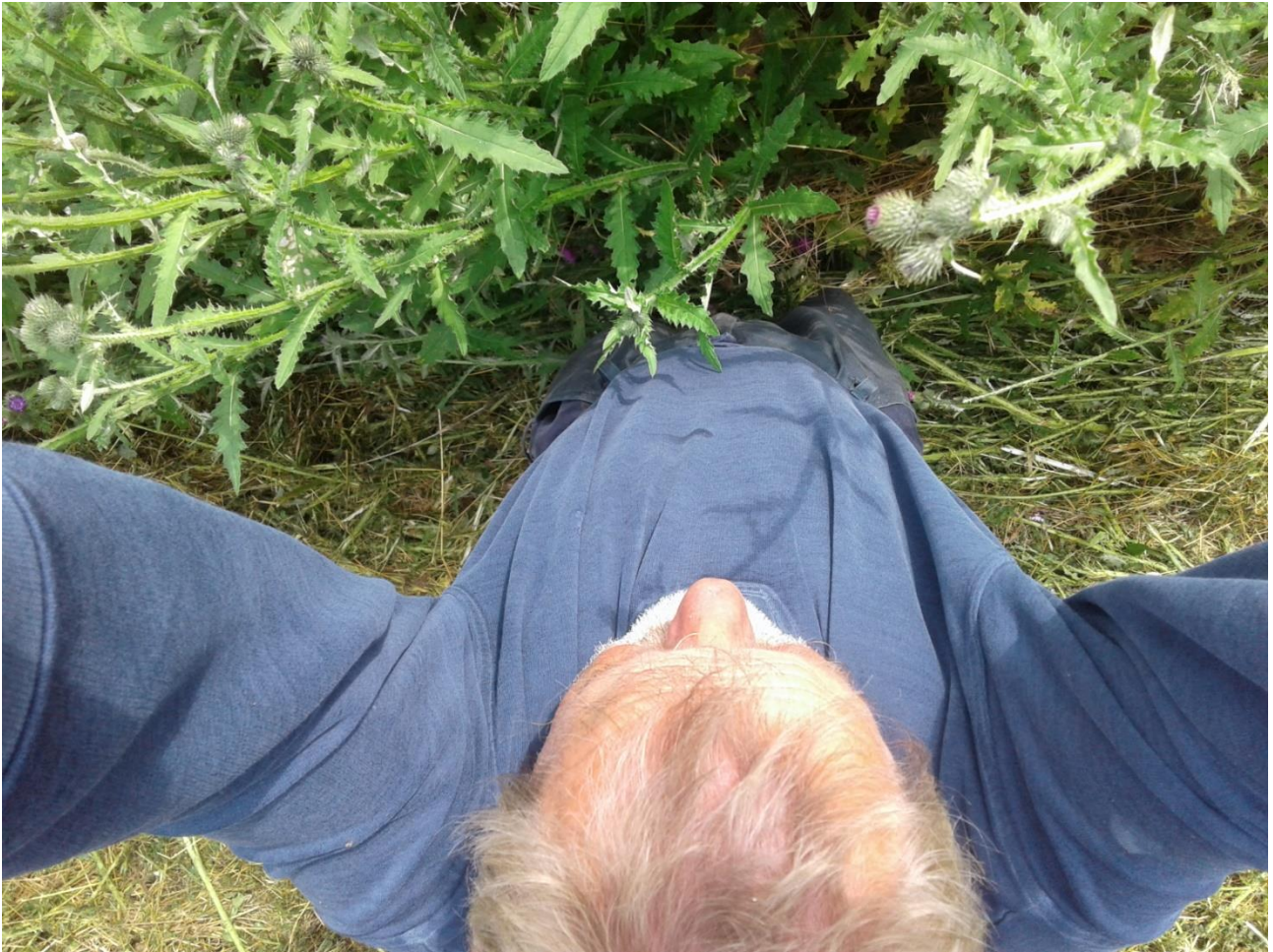
Foto: Mandshøje tidsler – og en enkelt agronom. Vurder selv tidslernes højde ud fra skyggen på min trøje op til min hage. Her kan ynglen af agerlandets truede arter ikke leve; her er mørkt, koldt og fugtigt. Det her er det modsatte af diversitet. Det er ensformighed.

Som en bonus for diversiteten vil hyppig og kort slåning fremme en række arter af urter, som trives med det regime som hyppig slåning udgør – det vil i princippet kunne udvikle sig som en græsplæne, der ikke behandles med ”plæne-rens”: masser af urter samt nogle græsarter. Der vil typisk være langt større diversitet end ved en høj bevoksning, idet en høj bevoksning hyppigst bliver overtaget af en af de ovennævnte dominerende arter.