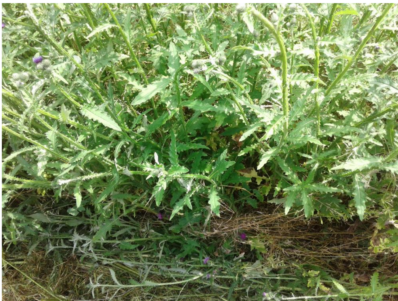
Foto: Mandshøje tidsler uden levemulighed for hønsefugles kyllinger, harekilling m.fl.

Slåningsforbuddet medfører, at den yngel, der nu ikke bliver ødelagt af slåning, skal leve i bunden af en høj bevoksning af arter som nævnt herover. Det er desværre ikke en mulighed. Harekillinger samt ynglen af såvel hønsefugle som lærke, vibe og andre af agerlandets arter, går simpelthen til i den høje bevoksning, fordi solens varmende og tørrende stråler ikke kan nå ned til jorden. De dør af at være permanent våde uden mulighed for at tørre, hvorved de bliver kolde, og går til. Så kan det jo være helt ligegyldigt, at reden ikke bliver ødelagt, hvis ynglen ikke kan overleve på grund af fugt og kulde.