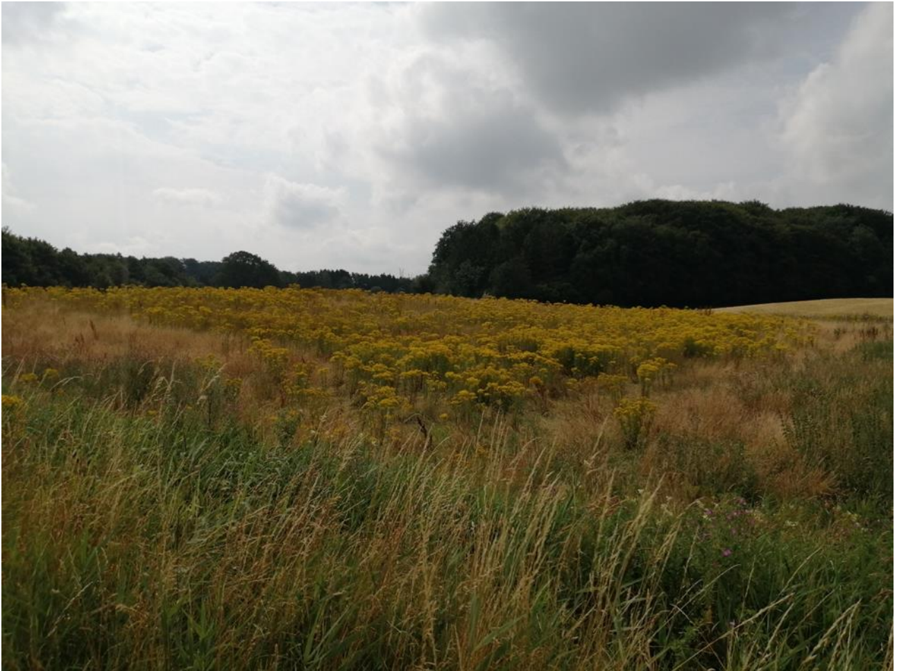
Foto: Ekstensiveret areal domineret af engbrandbæger. Forekomst og opformering af engbrandbæger på ekstensiverede arealer, og spredning derfra til bl.a. arealer med hestehold, er allerede et kæmpe problem. Kør ud i sommerlandet i juli og kig efter engbrandbæger og bliv chokeret. Engbrandbæger er meget dominerende, spreder sig meget og er meget tabsvoldende/generende.