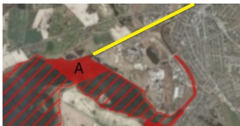
Udsnit af bilag 10 og 11

Vi må derfor kræve, at der også indføres en fangstbegrænsning på 1 ørred og 3 aborrer pr. person pr. dag i Næstved Kanal.