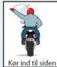
Kør ind til siden