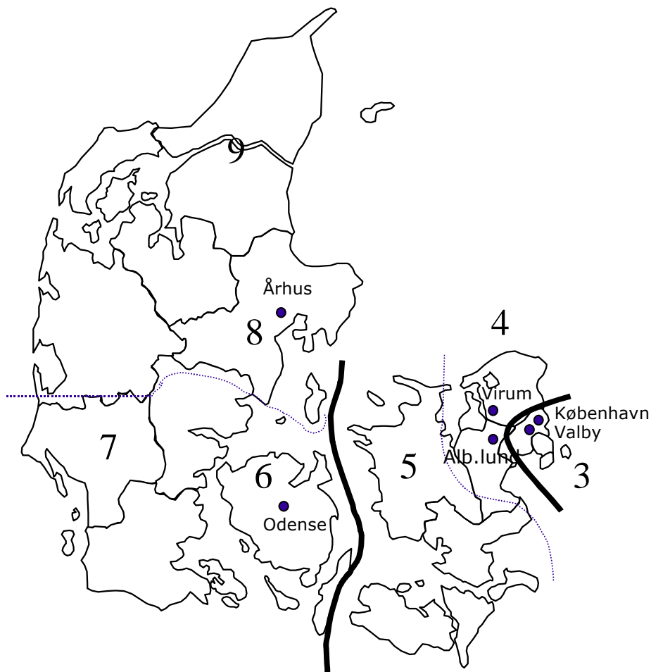
Samtrafikområder og samtrafikpunkter

TDC tilbyder tilslutning i to samtrafikcentraler i hvert af tre samtrafikområder som vist på følgende figur. Samtrafikområderne afgrænses af 1. ciffer i TDC's geografiske nummereringsplan. Disse samtrafikcentraler kan benyttes til samtlige samtrafiktjenester og til øvrige netjenester, og tilbydes til såvel danske som udenlandske Operatører.